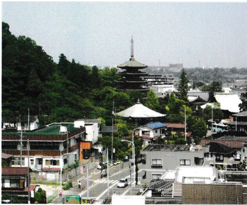
ホテルから高幡不動尊が見える立地がございます。