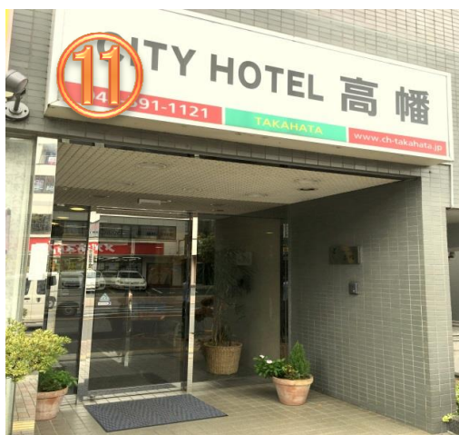
11 すぐにホテルの玄関がございます