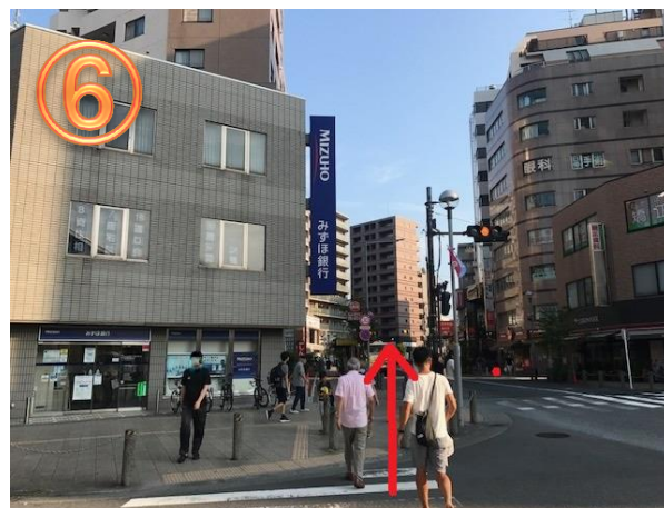
横断歩道を渡り、そのまま直進してください ホテルまではここから1~2分です