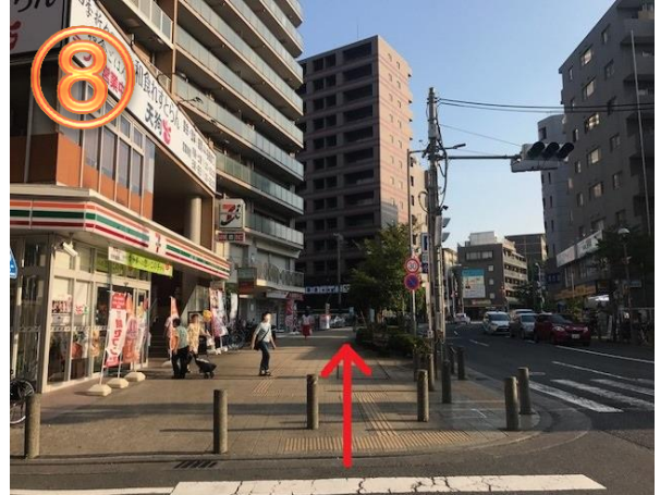
8 横断歩道を渡り、左手方向の『セブンイレブン』を 通り過ぎ、さらに直進してください