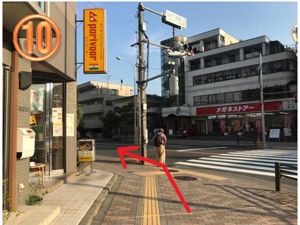
10 突き当たりを横断歩道を渡らずに 左へ曲がってください