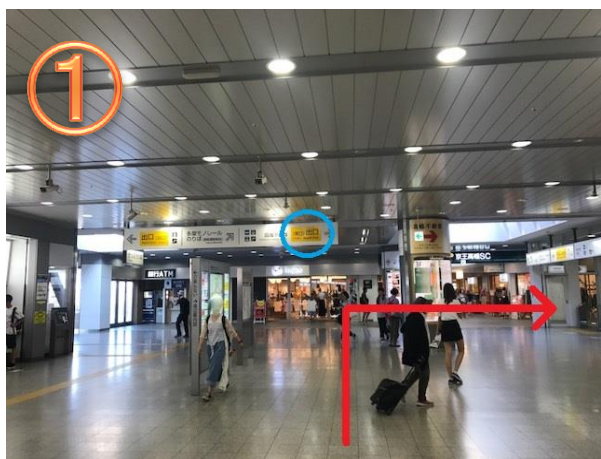
改札を出ましたら、右手(南口)へお進みください