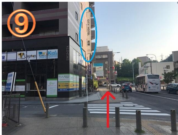
9 ホテルの看板が見えてきますので、 突き当たりまで進んでください