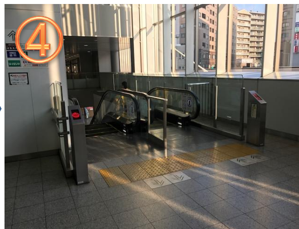
再度エスカレーターを下(1階・地上階)へ降りてください