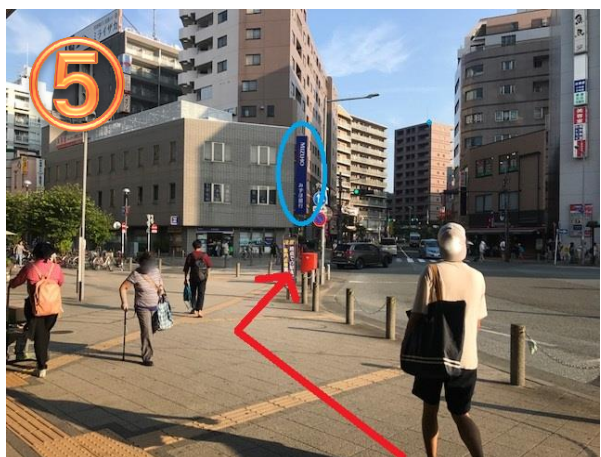
地上階へ出ますと、左手方向に『みずほ銀行』がございますので、そちらへお進みください