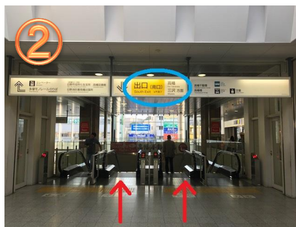
エスカレーターがございますので、改札階(3階)より下(2階)へ降りてください