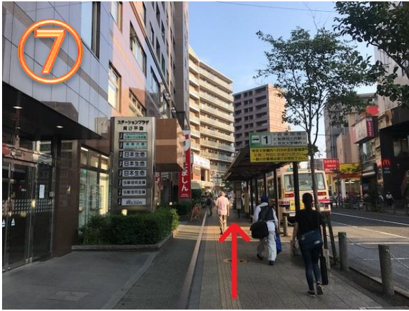
7 駅を背にしてお進みください 右手方向には『マクドナルド』がございます。